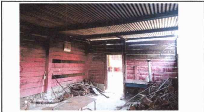
Foto 2: Imagen de cocina que necesita ampliacion de muros de contencion ya que cuentan con cimientos y bases de concreto.