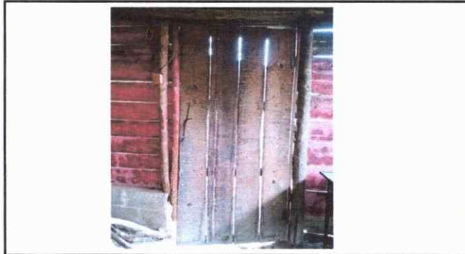
Foto 3: Imagen de puerta que necesita ser cambiada por una de metal para brindar seguridad a la cocina.