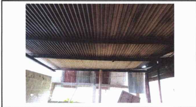
Foto 4: Otra vista del techo que esta en mal estado debido al paso del tiempo.