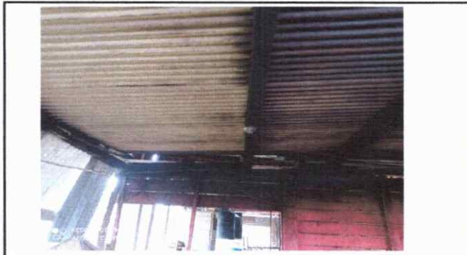
Foto1: Vista interior de laminas y estructura de metal con necesidad de cambio.